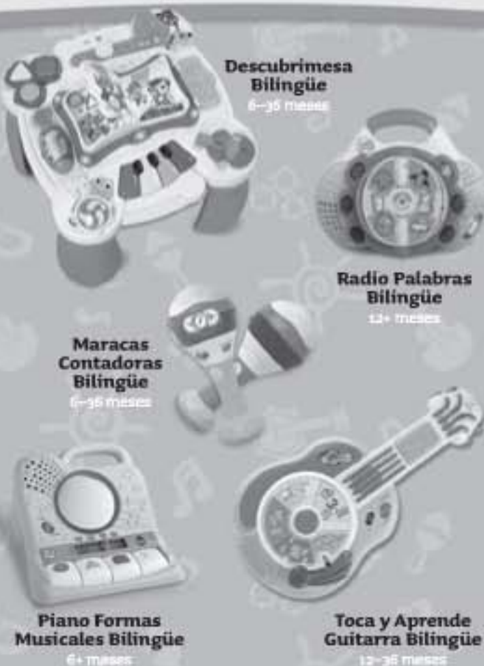
Descubrimesa Bilingüe 6-36 meses